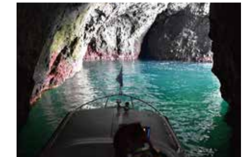
青の洞窟 【小樽・積丹】

言わずと知れた日本のてっぺん。多くの観光客やライダーが目指す国内最北の地。すぐ目の前にはサハリンの島影が見え、最果て感がたどよう場所。