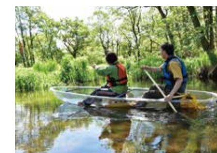
カヌー 【美々川・各地】

カラフルな気体にガスボンベから熱を入れてふわりと上昇。パイロットの操作でゆっくりと上空へ。催行は気象条件によるものの、大空からの眺めは感動的。