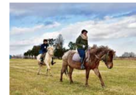
乗馬トレッキング 【各地】

大雪山国立公園唯一の自然湖。北海道の湖では最も高い標高810mにあり「天空の湖」とも呼ばれている。周囲にはオケササギやオジロワシ、クマガラなどが生息する。