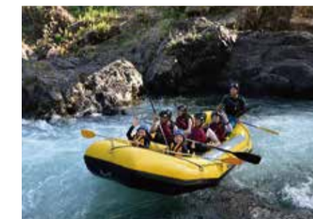
ラフティング 【各地】

近年人気の新しいスポット。小樽の青の洞窟へは小樽運河などから小型船や、シーカヤックで向かうツアーも。積丹の洞窟へはシュノーケルツアーがある。