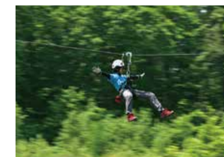
ジップライン 【大沼公園・各地】

苫小牧の樽前山麓にある渓谷。溶岩の大地を川が侵食し、切り立った岩が特異な景観を見せる。岩肌には深緑のコケが張り付いていてピロードのじゅうたんのよう。