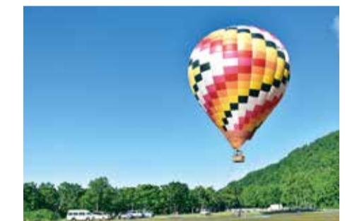
熱気球 【ニセコ・富良野】

北海道和種の「どさんこ」やサラブレッドに乗ってトレッキングができるツアーコースが道内あちこちにある。草原・海岸線・パノラマ眺望など多彩。