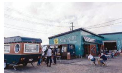
キッチンカーを販売する「STAND FACTORY」内に、2021年6月に誕生