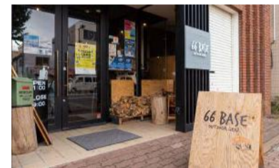
東室蘭駅徒歩圏内ニューヨークテラスビル1階に、2021年12月に誕生