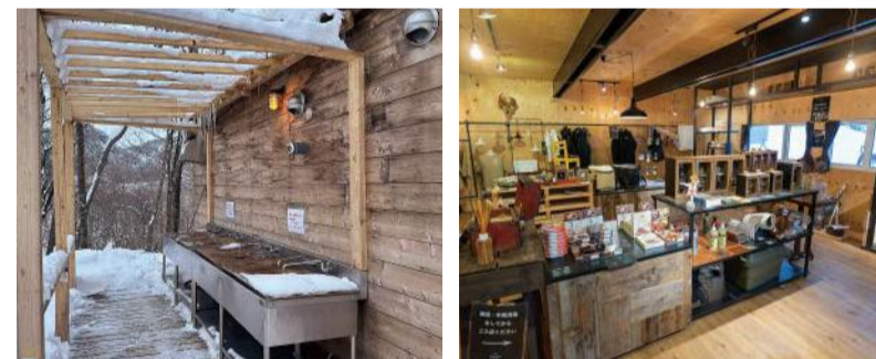
冬もお湯が使える炊事場 シャワー室もあり快適 管理棟のショップではオリジナルアイテムも購入できます

「本気で、遊ぼう。」がコンセプト トイレ、シャワー室、受付がまるでホテルのようなキャンプ場