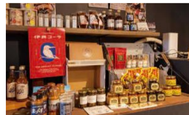
調味料は話題のものから地元ならではのレア商品が揃います