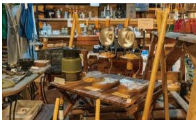
北海道ガレージブランドアイテムも豊富に入荷します