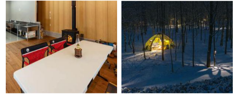
炊事場があるのは薪ストーブもあるコミュニティールームの一角 冬は雪原に映る灯りと林間の美しい景色が味わえます

川辺でできるアウトドアサウナも魅力 十勝を満喫 豪華グランピング&キャンピングフィールド