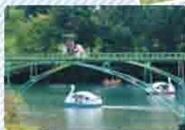
サイクルモノレール・ボート